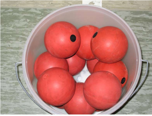
Da sind die Boßel...