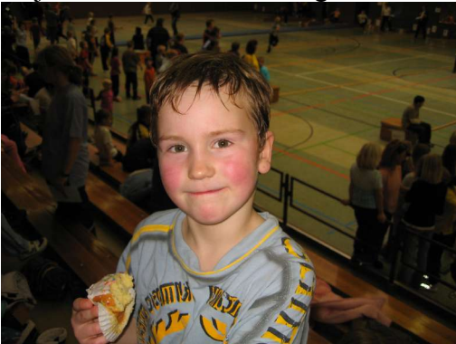
...und ihm auch