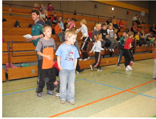
... und dann geht's los